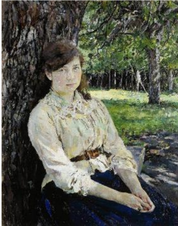
ВА Серов Девушка, освещенная солнцем